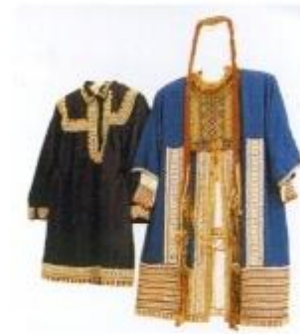
Традиционная калмыцкая одежда